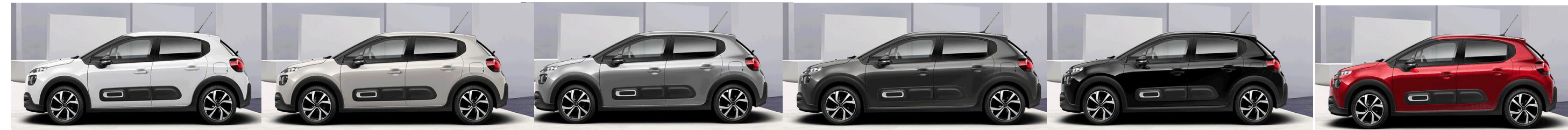
Blanc Banquise Sable Gris Acier Gris Platinium Noir Perla Rouge Elixir

Покрив и черупки на огледалата в цвят Noir Perla Nera