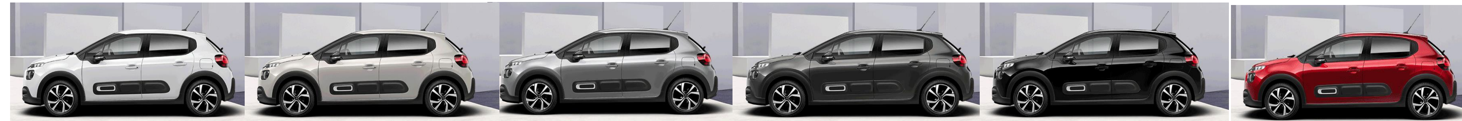
Blanc Banquise Sable Gris Acier Gris Platinium Noir Perla Rouge Elixir

Покрив и черупки на огледалата в цвят Noir Perla Nera