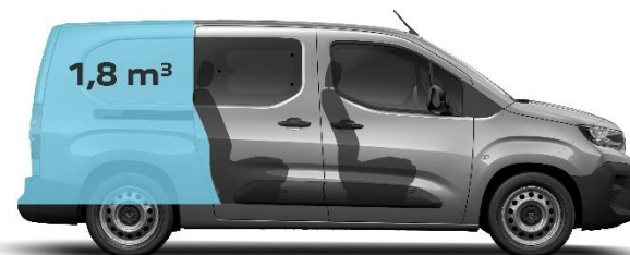
Row 2 retracted