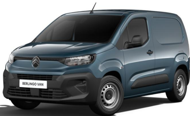
Син металик Libeccio Blue (M0M6)