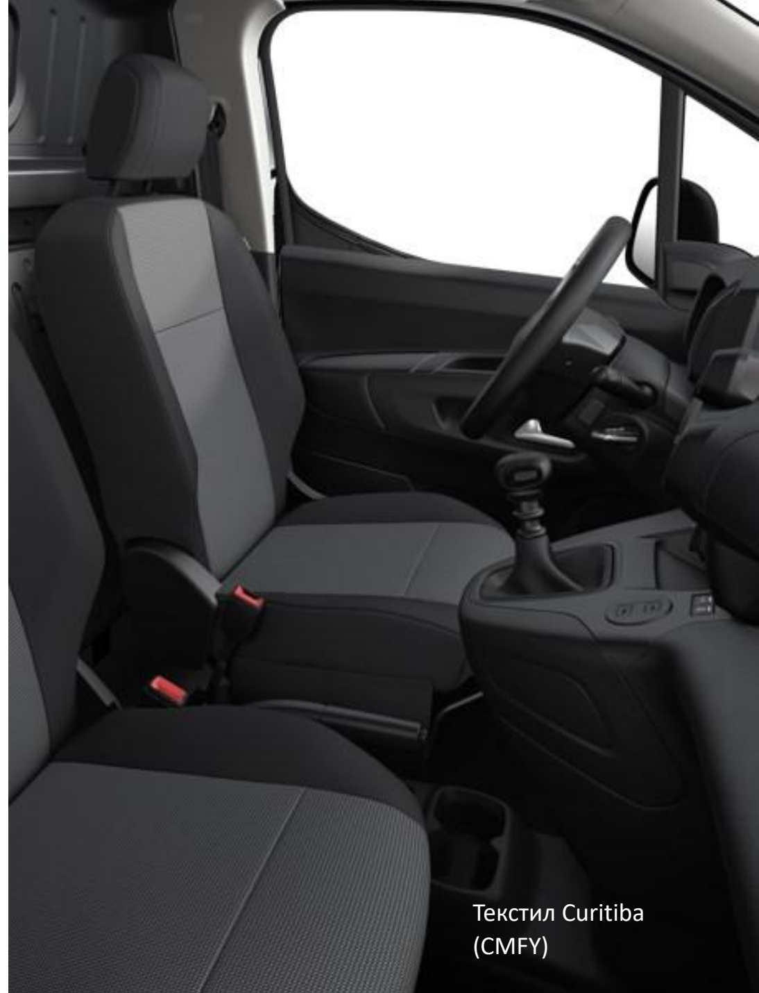
Текстил Curitiba (CMFY)