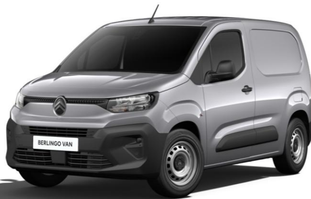
Сив металик Gris Acier (M0F4)