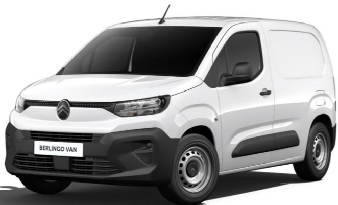
Бял неметалик Blanc Icy (POPR)