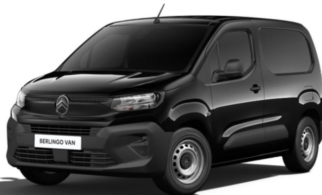
Черен металик Perla Nera (M09V)