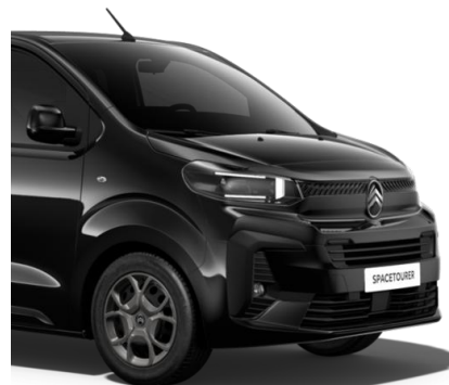
Черен металик Perla Nera (MO9V)