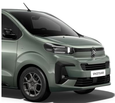
Зелен металик All-Terrain Gre (MODU)*