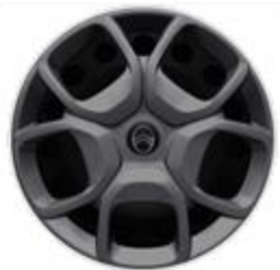
17" стоманени джанти с декоративни пълноразмерни тасове