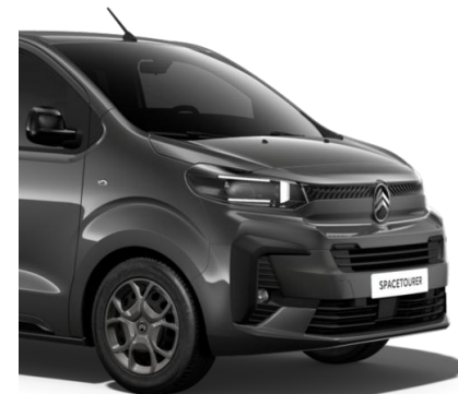
Сив металик Gris Titane (MO1J)