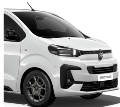
Бял неметалик Icy White (POPR)