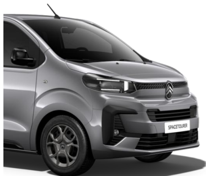
Сив металик Arctic Steel (MOF4)