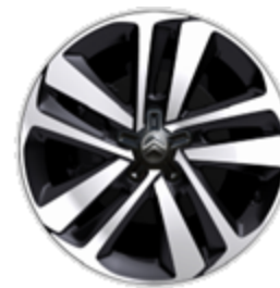
17" алуминиеви джанти с диамантен ефект