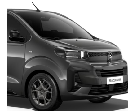
Сив металик Gris Titane (MO1J)