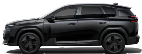
Noir Perla Nera M09V (металик)