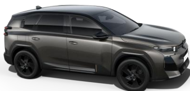
Gris Platinum M0VL (металик)