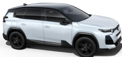
Blanc Okenite M0SU (металик)